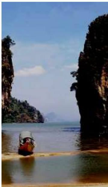
Po: B. Vrbovšek, Gospod, povsod vidim Tebe

Zdaj si želimo ohraniti milostni čas obnovljenih moči, zato v skodelice vsakdanjosti natakamo hrepenenje po tvoji bližini in te prosimo, da nas ohranjaš mehke in ljubeznive tudi sredi hladnih sap prvih jesenskih dni.