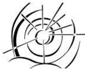
F. Rode, Zakladnica molitve

Gospod, naj svetloba tvojega vstajenja ožarja naše dneve, premagaj strah v globinah naše zavesti. Naj utihnejo naše žalostne popevke, naj umolkne krik obupa. Naj žarki velikonočne zarje zasijejo v naših očeh in odsevajo na naših obrazih. Naj tvoja radost osvoji naša srca. Gospod, daj nam zmagovito upanje. Premagaj nas! Premagaj naše zakrknjeno srce, razbij naše plahe misli, preženi našo grešno žalost. Odpusti nam grehe proti veselju in upanju.